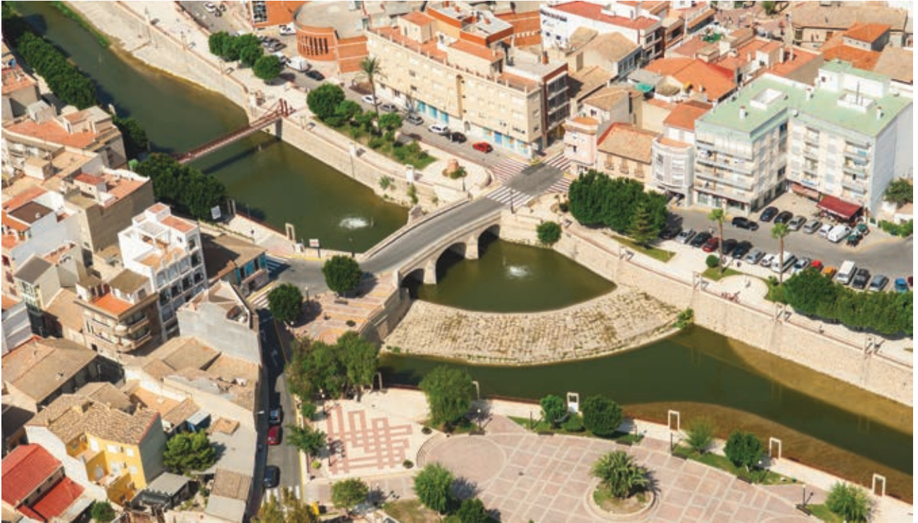
PUNTE CARLOS III, NORIA Y AZUD

ES Conjunto de monumentos de carácter histórico-artístico representado por el Azud, Boqueras de Acequia, Noria y Puente de Sillería (siglos XVI-XVIII), constituyen un hito paisajístico y urbano.