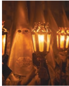
Semana Santa Marzo/Abril - March/April