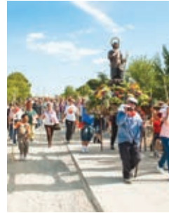
Romería de San Isidro Mayo - May