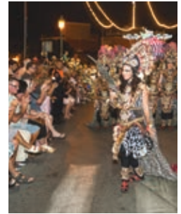
Fiestas de Moros y Cristianos en honor a San Pedro Junio/Julio - June/July