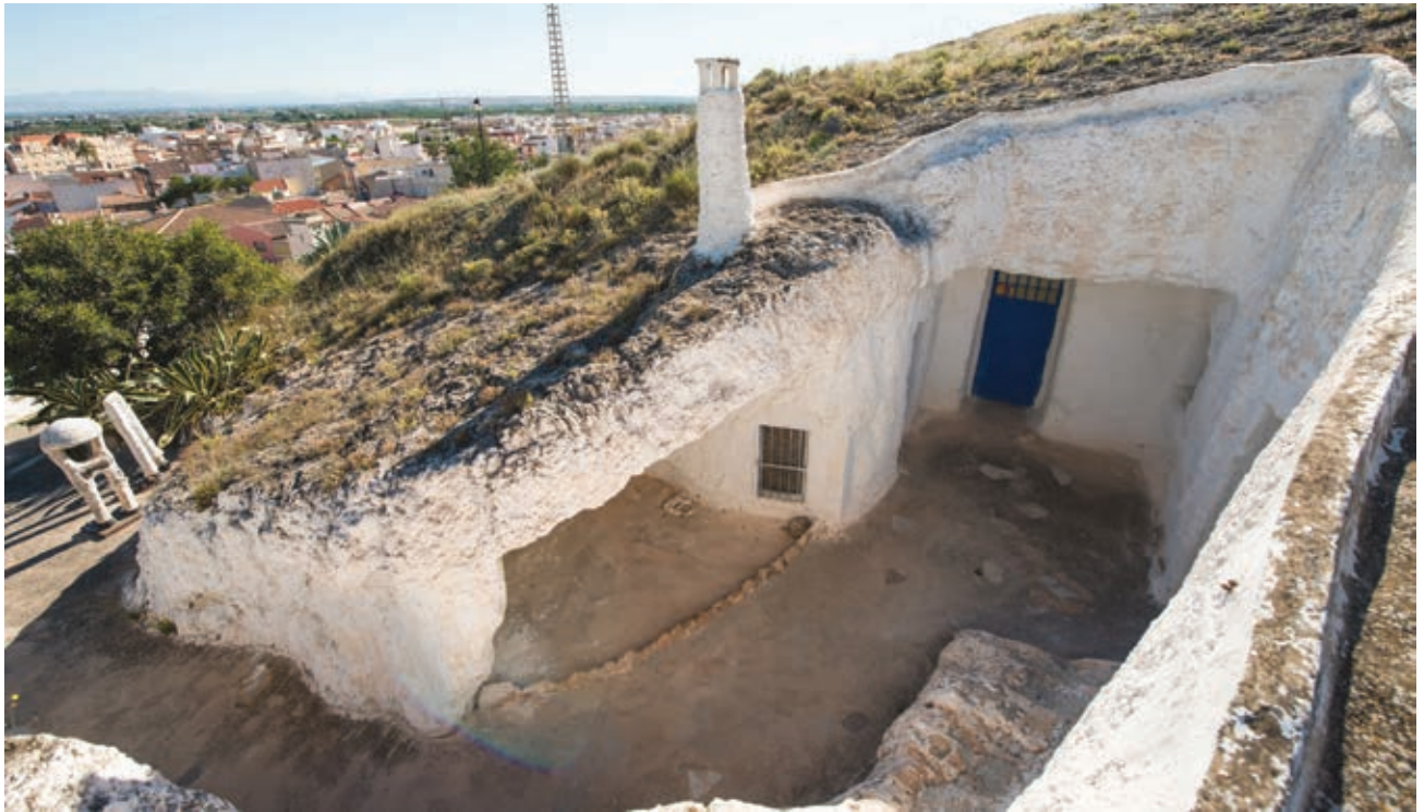
ECOMUSEO DEL HÁBITAT SUBTERRÁNEO MUNICIPAL Y ZOCO DEL BARRIO DEL RODEO

ES Las Cuevas del Rodeo son un complejo tradicional de viviendas excavadas en la roca entre los siglos XVIII-XX, actualmente rehabilitadas como cuevas-talleres artesanales y salas de exposición.