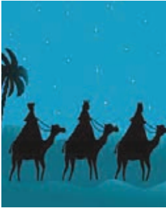
Cabalgata de Reyes Enero - January