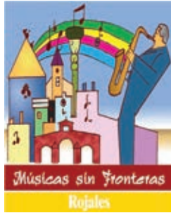
Músicas sin Fronteras Marzo - March