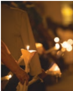
Fiestas en honor a San Roque y la Virgen del Rosario en Heredades Agosto - August