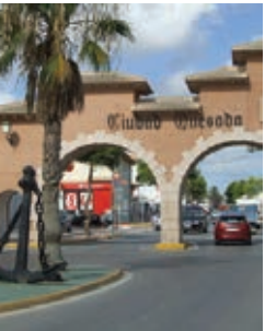
Fiestas en honor a San Justo de Ciudad Quesada Agosto - August