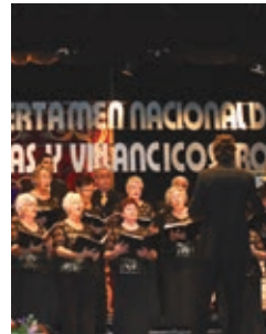
Certamen Nacional de Nanas y Villancicos Villa de Rojas Diciembre - December