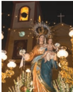
Fiestas en honor a la Virgen del Rosario Octubre - October